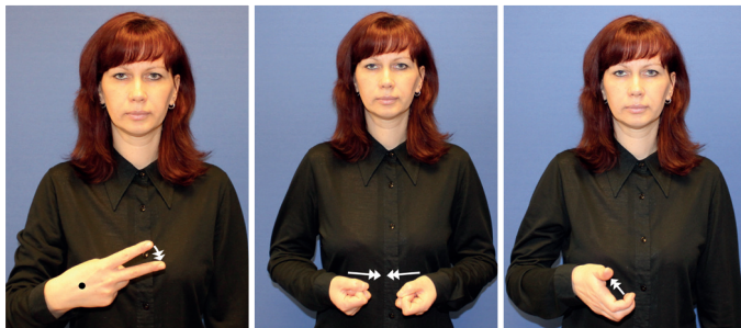
Dzirkles, grieznes, šķēres (dārzam) (1)