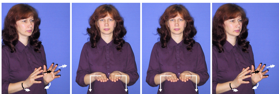
Kamīnkrāsns, apkures krāsns