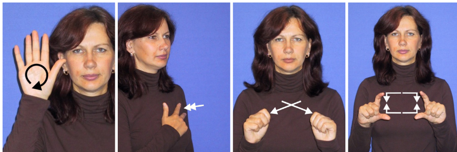
Valsts sociālās apdrošināšanas aģentūra - VSAA (1)