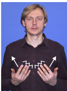
Demontēt (1), izjaukt (1)