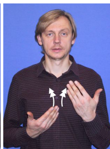
Demontēt (2), izjaukt (2)