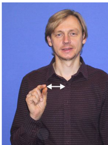
Atzīmēt (ar līmeņrādi) (2)